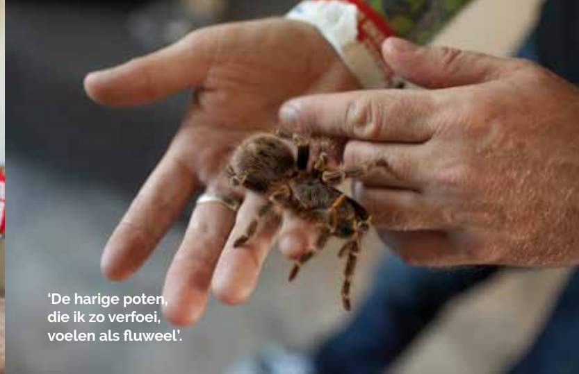
'De harige poten, die ik zo verfoei, voelen als fluweel'.